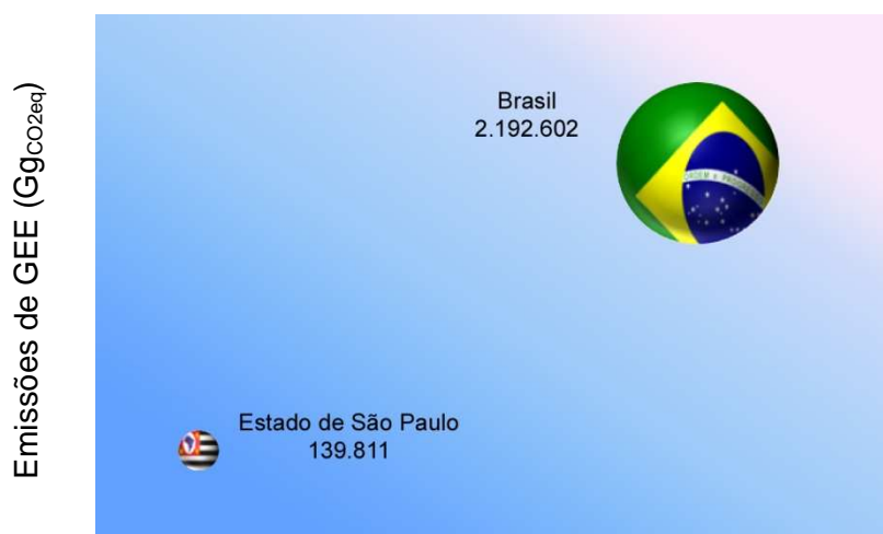
Gráfico 1 - Emissões de GEE do Estado de São Paulo e do Brasil em 2005

O Gráfico 2 apresenta a distribuição das emissões de GEE do Estado de São Paulo e do Brasil, onde podem ser notados os setores da economia mais relevantes em nível estadual e nacional.